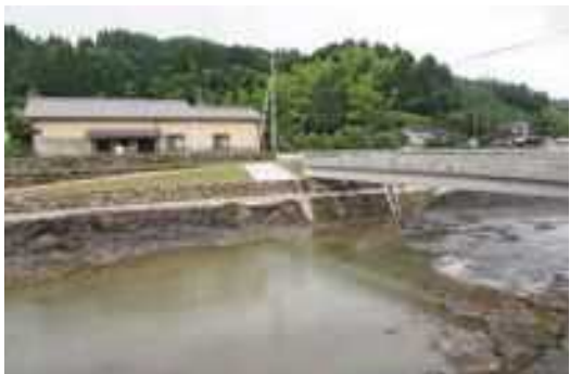
〈復旧工事後〉橋脚を無くし、川幅を広げ、川底の掘り下げを行っている。