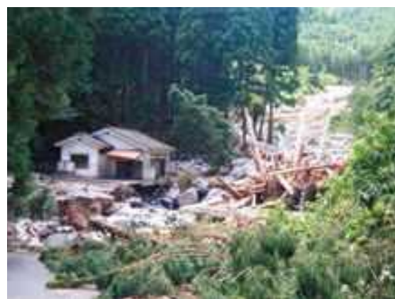
土石流により被災した家屋