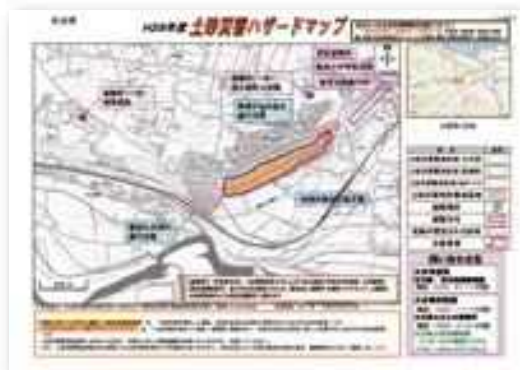
ハザードマップの見本

お答えするため、県内各土木事務所に相談窓口を設けています。ご不明な点等があれば、お問い合わせ下さい。