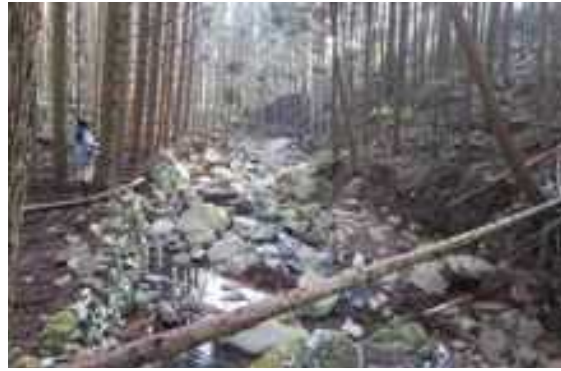
整備未実施 倒木が流木化する恐れのある河川沿いの森林