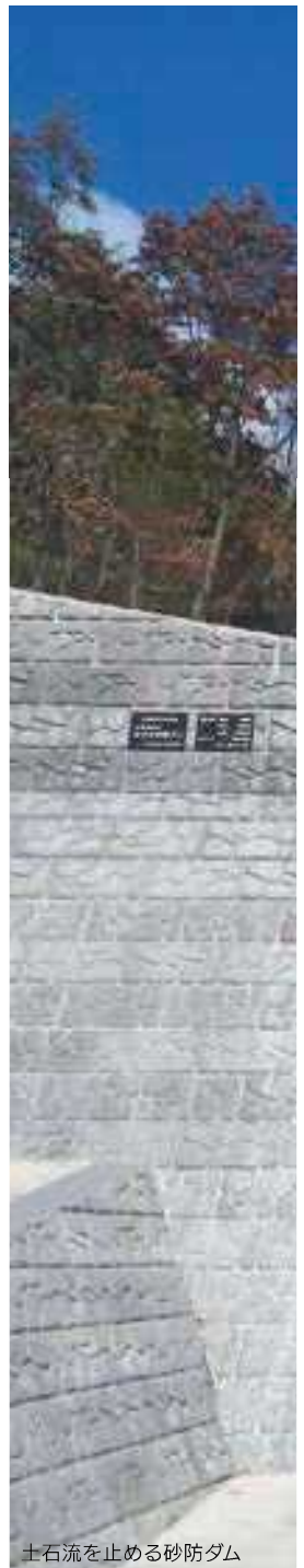
土石流を止める砂防ダム