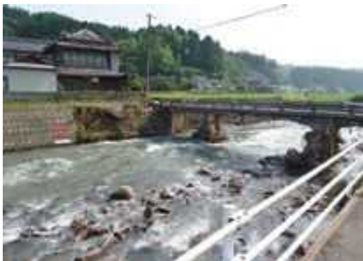
〈被災後〉橋脚に流木等が引っ掛かってしまい、川を氾濫させる一因となってしまった。