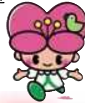
大分県人権啓発 イメージキャラクター こころちゃん

差別を解消するためには、私たち一人ひとりが自らの課題として差別のない社会の実現に取り組む必要があります。みんなが部落差別の問題を正しく理解し、正しい行動につなげましょう。