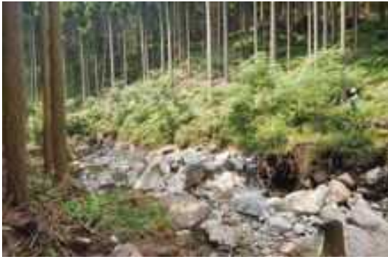
整備後 (H29. 豪雨災害後の状況) 倒れそうな木を予め伐採したことで、下草が繁茂し、伐採跡には広葉樹が生えてきている