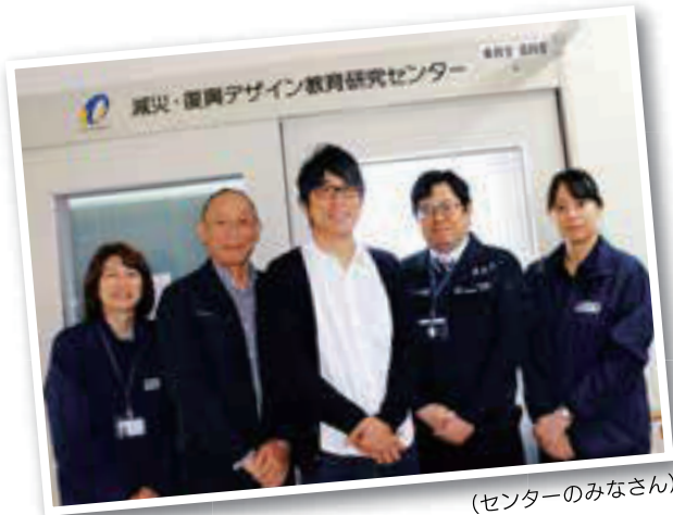
(センターのみなさん)

「洪水浸水想定区域にある学校に対して防災についてアンケートを取ったことです。学校で一番取り組まれている防災教育は