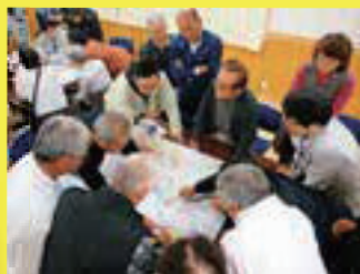
中津市山国町宇曾地区の様子