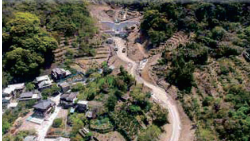
江ノ浦川(平成29年 台風18号による被害箇所の復興状況)