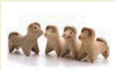
中世大友府内町跡出土の犬形土製品