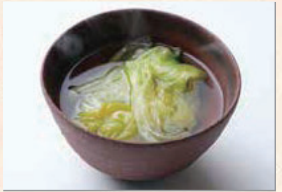
レシピ提供: 宇佐美友香(臼杵市 フードコーディネーター)