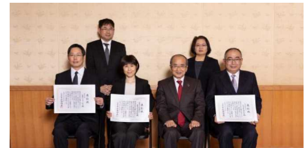
表彰式（平成31年2月27日）