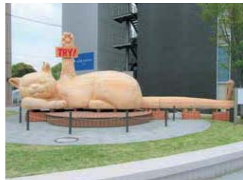
大分市昭和通り交差点で観光客をおもてなしする巨大寝ころび招き猫「福猫ふくにゃん」

中学生が作成した大分県の特色や英語を織り交ぜたウェルカムカードを、観戦客に配布します。