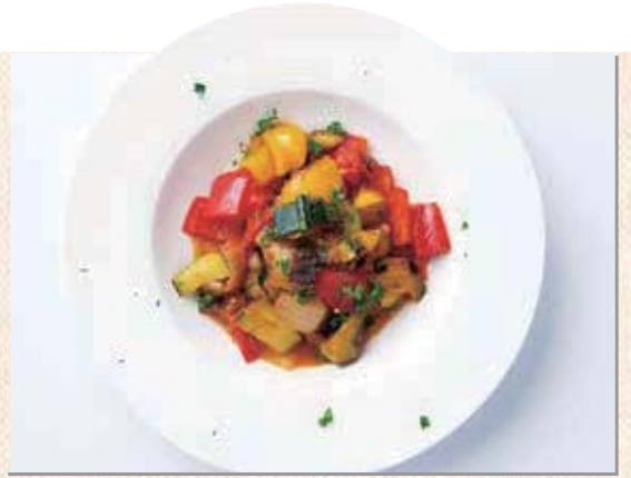
レシピ提供：坂本君枝(野菜ソムリエ上級プロ)