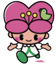
大分県人権啓発 イメージキャラクター こころちゃん

誰もが、自分らしく幸せに暮らしていける社会を望んでいるのに、それを阻むものが差別です。「誰かがなくしてくれる」と思っても差別はなくなりません。「私」自身が差別をなくすためにどう行動するのが大切です。まずは、自分にできることから始めましょう。