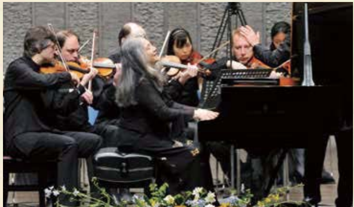
別府アルゲリッチ音楽祭より