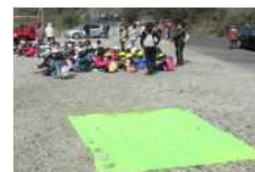
(孤立信息) ※投稿参考