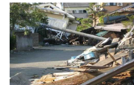
(房屋倒塌引起的道路闭塞) ※投稿参考