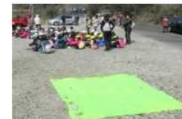
(고립정보) ※투고 이미지