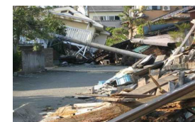
(무너진 가옥에 의한 도로 폐쇄) ※투고 이미지