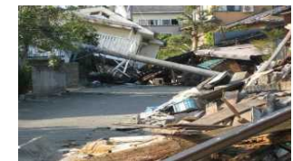
(Nhà sập làm tắc nghẽn giao thông) *hình ảnh minh họa