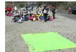
(Thông tin cô lập) *hình ảnh minh họa

Link website chuyên dụng : https://www.bousai-info.jp/kyushu/oita/index.html