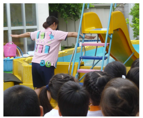
(舟の大きさは)先生の手で測ったら？