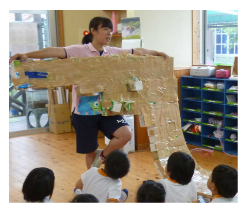
本当に、プールに入るのかな？