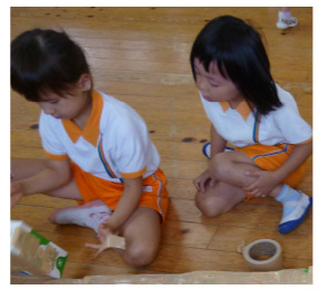
② どうやって裏側に貼ろうかな？