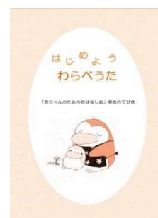
【『はじめよう わらべうた』 平成26年度:県立図書館】