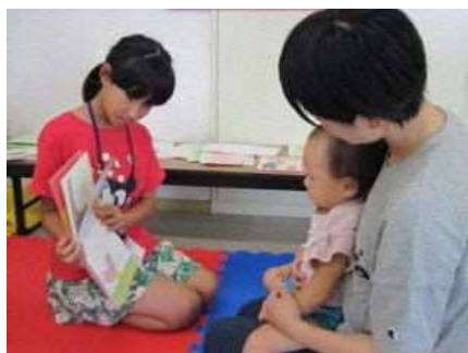
【国東市ブックスタート事業で読み聞かせをする子ども司書】