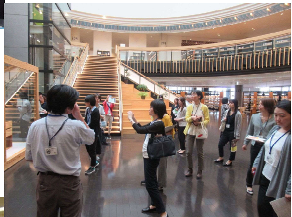
【公立図書館等職員研修会の様子】