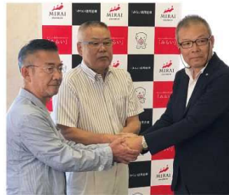
(有)ぶたまんの店幸崎から (株)クリエイツへの第三者事業承継