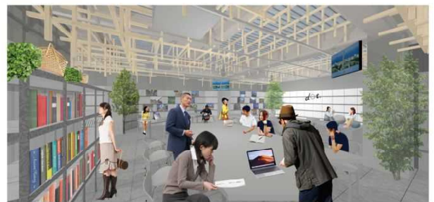
福岡市中央区大名1-15-35 大名247ビル 2階