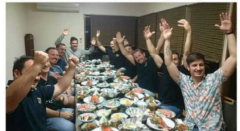
ラグビーワールドカップで 大分県を訪れた外国人観光客