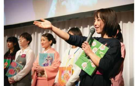
第3回おおいたスタートアップウーマンアワード