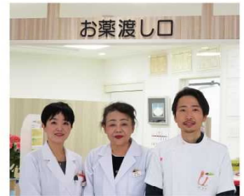
中央薬局での親族内事業承継