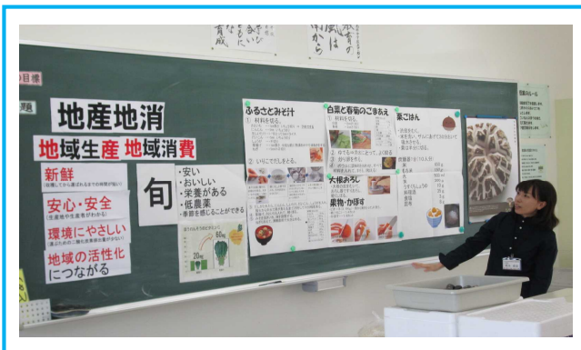
栄養教諭による親子料理教室の授業場面