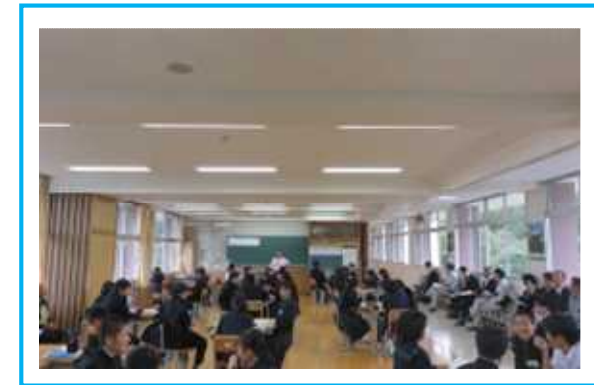
協調学習 2年 「睡眠と健康」