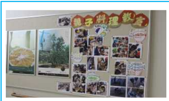
親子料理教室の様子