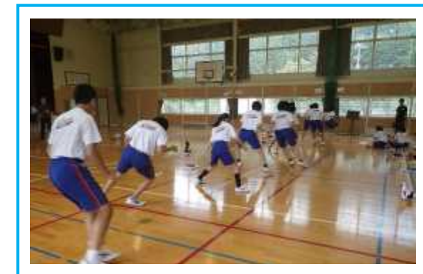
全校体カテストの1場面