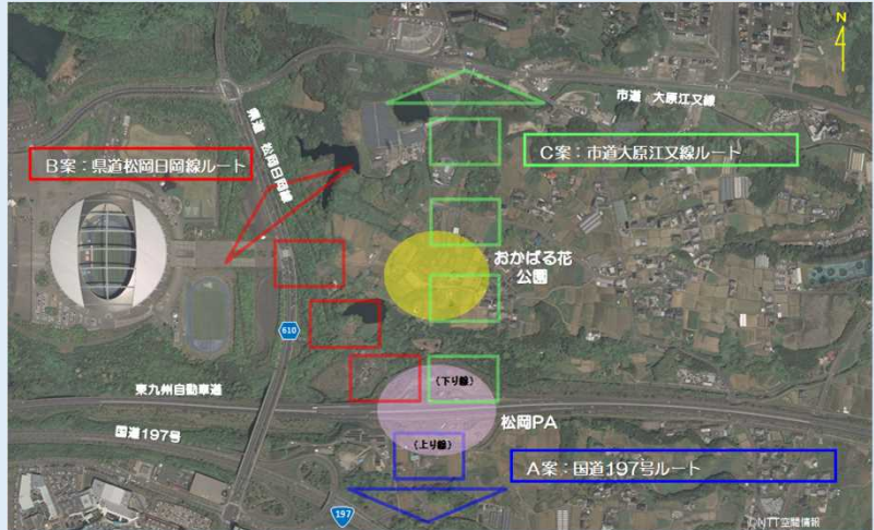
図 松岡S I C連結道路の概略ルート