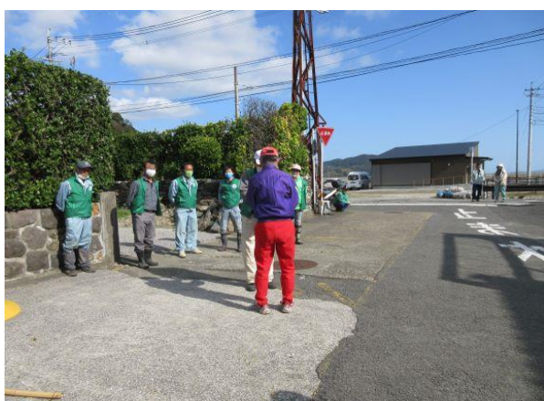
作業前のあいさつ、作業内容確認