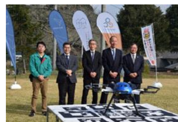
上村の郷にて各団体代表と PF2

本実証実験は大分県ドローン物流活用推進事業を活用した取り組みで、大分県杵築市を対象とした地域における実装をゴールとして、ドローンシステムインテグレーターであるブルーイノベーション、地元企業であるオーイーシー、きっとすきが連携して検証を進めるものです。