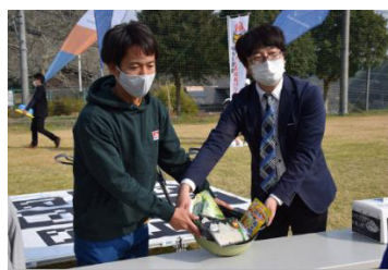
ドローンで運ばれたハモ鍋の食材セット