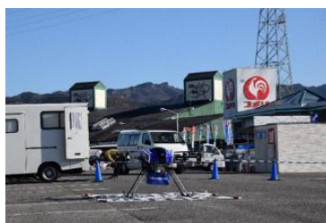
神田楽市から離陸するカーゴドローン

ブルーイノベーション株式会社(本社：東京都文京区、以下「ブルーイノベーション」)、株式会社きっとすき(本社：大分県杵築市、以下「きっとすき」)、株式会社オーイーシー(本社：大分県大分市、以下「オーイーシー」)と大分県は、この度、大分県杵築市で地域定着を見据えたドローン物流の実証実験を行いました。