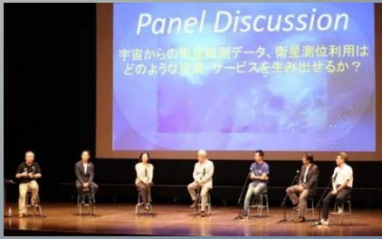
小组座谈会时的场景

计划于2021年6月开幕的第33届宇宙科技及科学的国际学术交流会(ISTS)之大分府大会启动会议于8月9日(周六)和9日(周日)召开。