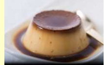
(别府市) 地狱蒸布丁