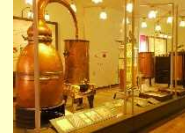
(别府市) 香气森林博物馆