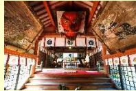
(大分市) 柞原八幡宫