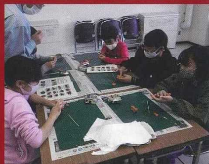
歴史体験学習(土器作り)

大分県立埋蔵文化財センターは、埋蔵文化財の発掘調査や発掘調査で出土した土器や石器等の展示、火起こしや鋳造等の歴史体験学習を行っている大分県の教育機関です。