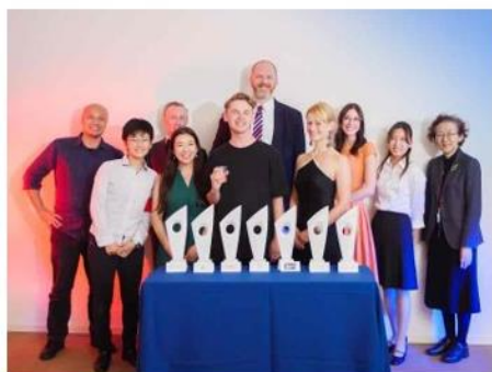
与东京工作伙伴共同参加线上活动

习新的技能，边积累新的人脉和经验，在东京的生活过得非常愉快。大分县永远都是我的第二故乡，期待着和各位能有重逢的机会！