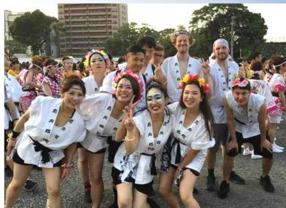
在大分，与伙伴们一起参加夏之府内战纸活动