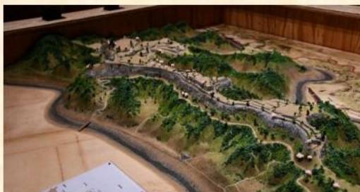
用APP查看岡城立体地图就会呈现...

1: 800的“岡城”的立体地图上，可以观赏到在断崖绝壁上高高耸立的岡城全景。在app商店中搜索“岡城时空散步”APP并下载打开，就可以看石墙上的建筑浮影。