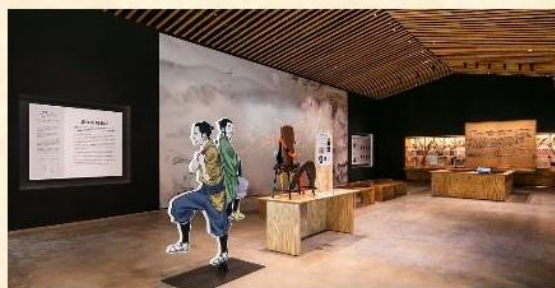
我们推荐先参观导航中心，然后再登上岡城

另外还可以在石垣剧场观看以漫画“丰后岡城物语”为原型的影片，岡城和城下町的墙挂地图、还有来访者可自由撰写推荐信息的情报中心等。