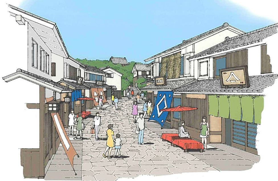
—歴史資源を活かしたまちなみ形成のイメージ—