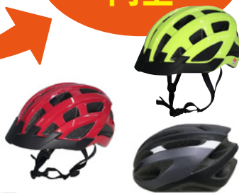
自転車用ヘルメット