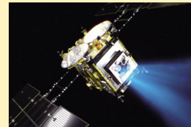
小惑星探査機「はやぶさ2」の想像図