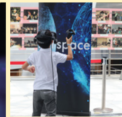
VRによる月面やり投げ体験 ©ISTSキックオフイベント