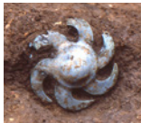
ともえがた 巴形銅器出土状況 (雄城台遺跡/ 大分雄城台高校)