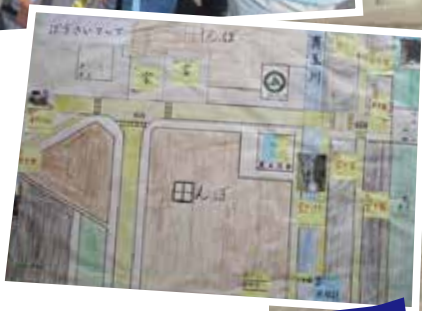
防犯マップ作成の授業も！