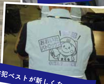
防犯ベストが新しくなったよ！