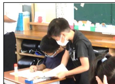
NO.143 2021年6月 大分市立丹生小学校