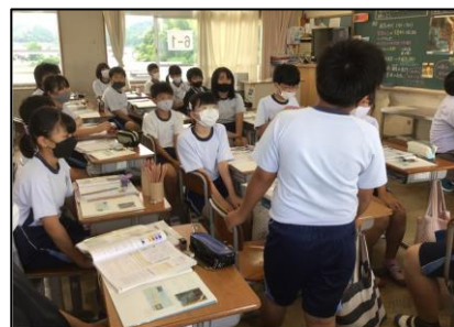
NO.142 2021年6月 大分市立丹生小学校

「はいっ」と、小さな「っ」が、はっきり聞こえる、メリハリのあるいい声が響きますね。