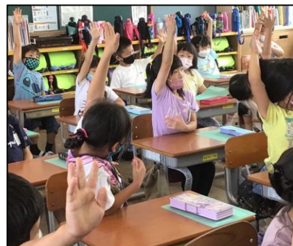
NO.141 2021年6月 大分市立丹生小学校

今後は、授業の終末の「振り返り」で、子ども達がどのような事を書くのか、どんな姿になったら良いのか等、教師が願う具体的なゴールの姿とすることで、「ねらい」との連動や、評価規準がより明確になります。そのような、具体的な実践を日常的に行うことで授業力がより向上すると思われました。