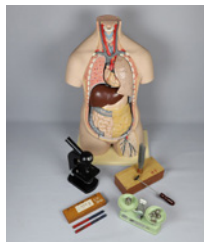
旧山国町立清部小学校の理科教材