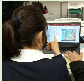
地理院地図を活用し学校周辺の地形を把握