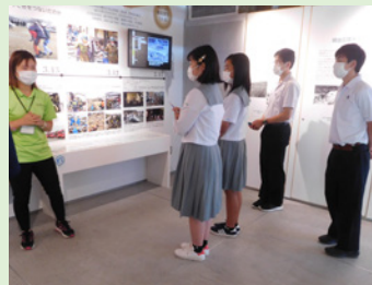
高校生防災リーダー研修

大分県教育委員会では、平成24年度から文部科学省の委託を受けて「防災教育モデル実践事業」に取り組んでいます。この事業では、指定を受けたモデル校が、地域の災害リスクに備えた防災教育の実践や、学校における防災教育の効果的手法等を研究し、その成果を県下の学校に普及します。これまで延べ40校がモデル校として、地震・津波・水害・土砂災害に関する学習や、危機管理マニュアルの改善、避難所運営対策などに取り組んできました。