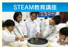
「月移住計画」をテーマにした講座 ※県外派遣講座もあります。