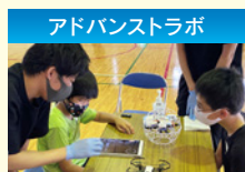
ドローンを活用したプログラミングのシリーズ講座