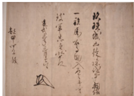
都甲家文書 [足利尊氏軍勢催催状] (大分県指定文化財・先哲史料館寄託)

我々の先祖たちがその時代を生きてきた証である古文書などの文化財は、ふるさとの歴史と文化を知る上で貴重な手がかりとなります。展示では、当館が収蔵する古文書や絵図などの歴史資料を通して、文化財の調査・保護を行った「先哲」たちの事跡を紹介します。