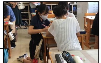
NO.204 2021年7月 緑丘小学校