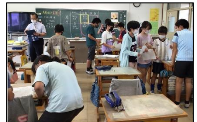
NO.202 2021年7月 緑丘小学校

やる気のある人は指先を見ればわかる。 成長するクラスは、友達の良さを素直に真似る。