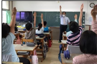
NO.203 2021年7月 緑丘小学校

何を書いても正解 、 っているのが自由な かんじてよかった みんなと拍手か出来た うわさ、た(り) 立て友だ と 話 のかた のしい 。