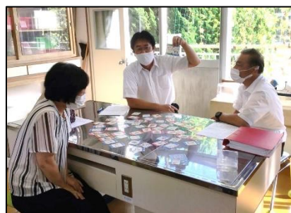
NO.331 2021年9月 由布市立石城小学校 研修

感謝の気持ちを言葉で伝える。 伝えられた人も伝えた人も、 周囲の人も笑顔になる。