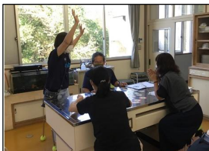
NO.330 2021年9月 由布市立石城小学校 研修