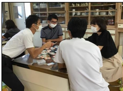
NO.330 2021年9月 由布市立石城小学校 研修