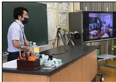
NO.331 2021年9月 由布市立石城小学校 研修