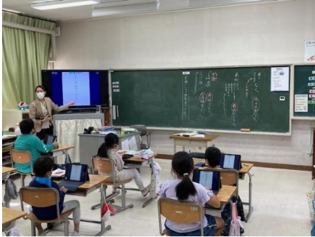
2年 国語科 ⇒1人1台端末の活用