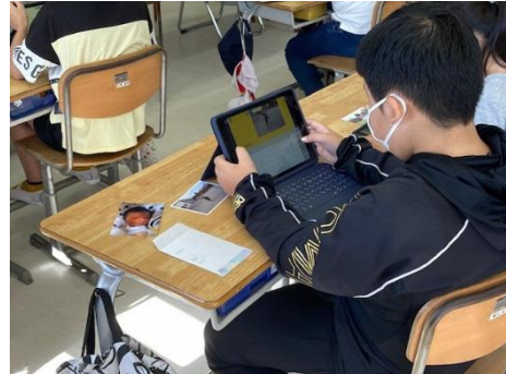
4年 総合的な学習の時間 ⇒プレゼンの作成