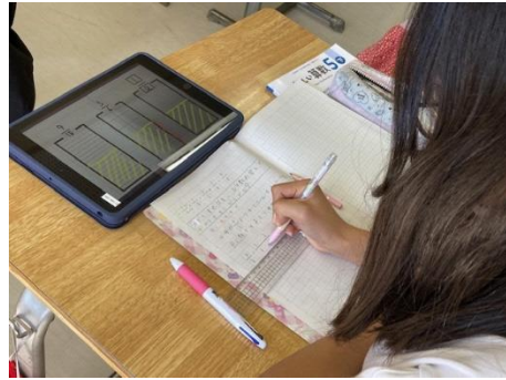
5年 算数科 ⇒分数の表し方