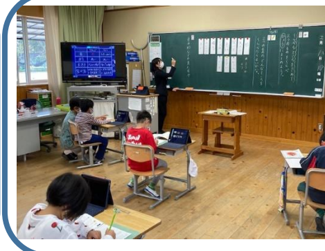
2年 国語科⇒1人1台端末