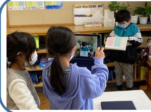
1年 国語科⇒タブレット端末の活用