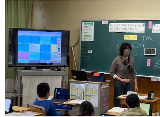
3年 国語科⇒1人1台端末