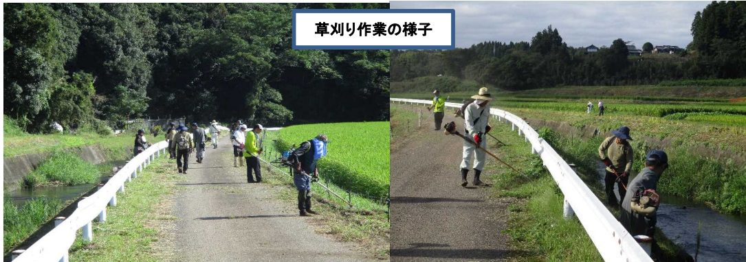
草刈り作業の様子