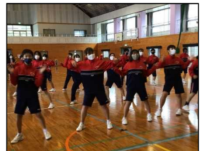
NO.564 2021年12月 大分市立城東中学校