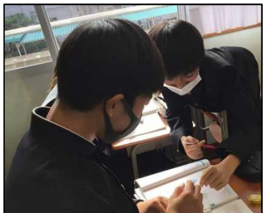
NO.561 2021年12月 大分市立城東中学校