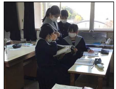
NO.562 2021年12月 大分市立城東中学校