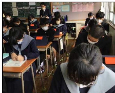
NO.563 2021年12月 大分市立城東中学校