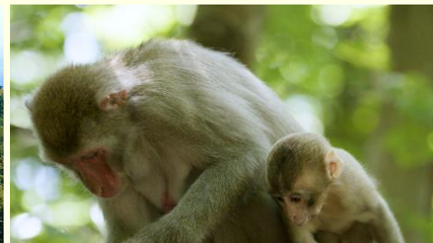
路上偶遇的日本猴母子