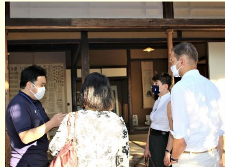
（左图）与竹田市长友好会晤的上校夫妇 （中图）滝廉太郎纪念馆、（右图）正在视察日田市咸宜园的上校夫妇

行程第二天，上校夫妇造访了因温泉研究项目与巴德科罗辛根市结为友好城市的竹田市，以及广濑知事的故乡日田市。在竹田市期间与土居市长进行了友好会晤，视察了滝廉太郎纪念馆、和以“竹乐”出名的广濑神社。在日田市则到访了咸宜园、重要无形文化财产“小鹿田烧”之里的烧窑山。第三天，为纪念日德友好160周年，在别府大学举办了以“日德文化交流”为题的演讲会。