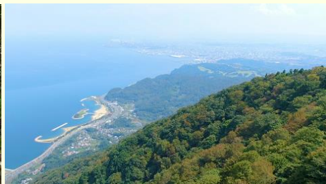
从山顶远眺田之浦海滩等大分市景