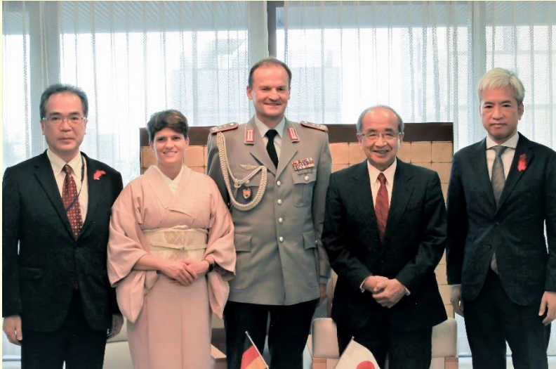
Kiesewetter上校（中央）和上校夫人（从左数第二位）。夫人的和服是自己去和服教室学习的穿戴方法。

10月14日（周四）驻日本德国大使馆的Kiesewetter上校及其夫人到访大分县，与广濑知事进行了会晤。上校造访了与其家族有渊源的场所、并发表了纪念演说。