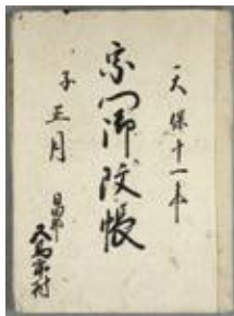
「宗門御改帳」 (五馬市村森家文書)