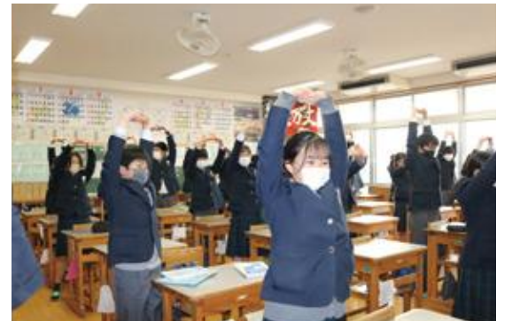
日田三隈中学校(生徒会主体の朝のストレッチ)