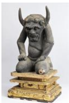
鬼大師坐像 [国東市・文殊仙寺所蔵]