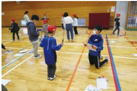
中津市立大幡小学校(休み時間の縄跳び練習)

コロナ禍であっても、各学校が感染状況や児童生徒の実態に応じて「一校一実践」を工夫して取り組んできました。休み時間に行う縄跳びや、生徒会主体で行う朝のストレッチ運動など、感染症対策を講じながら時間を有効に活用して、運動の習慣化・日常化を目指しています。