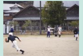
朝地小中学校の様子(朝地フレンドクラブ)