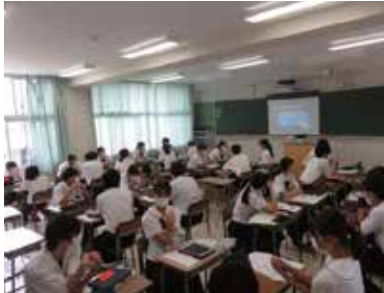
外部講師によるオンライン講義

地元宇佐市に学び、課題解決を目指して取り組む探究学習に、デジタルシンキングによる「6秒動画」制作をはじめとするSTEAM教育を取り入れ、ゼロから新しい価値を生み出すための視点を身につけることで、世界を展望し、自分の将来、宇佐市の将来への可能性を広げていきます。