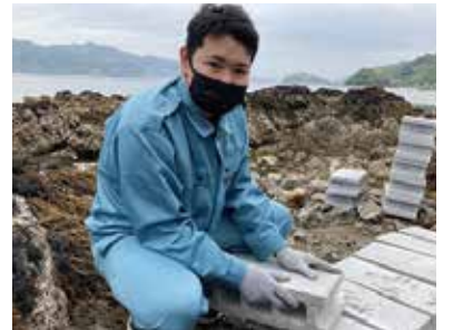
ヒジキ増殖ブロックの設置

高校生の協力で放流アワビの種苗等に標識付けをしています。一見地味な作業ですが、水産生物の生態を知るためには重要な作業です。真面目に作業へ取り組む姿勢にいつも感銘を受けています。今後も高校生と連携する機会を作ってほしいと考えます。