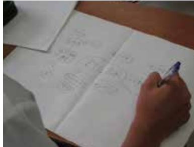
熱心にメモをとる生徒