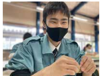
アワビの標識付け