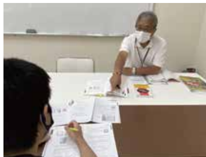
相談者と一緒に学習計画を立て、学力に応じて指導していきます。