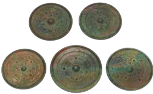
三角縁神獣鏡(宇佐市赤塚古墳)国指定重要文化財 [京都国立博物館所蔵]

今年は、当館の前身「歴史民俗資料館」が開館して40年、宇佐風土記の丘にある赤塚古墳から三角縁神獣鏡が発見されて100年の節目の年にあたります。それらを記念して、宇佐風土記の丘の川部・高森古墳群に焦点をあて、古墳時代の分県の人々と九州や瀬戸内海、近畿地方とのつながりを示す資料を展示します。