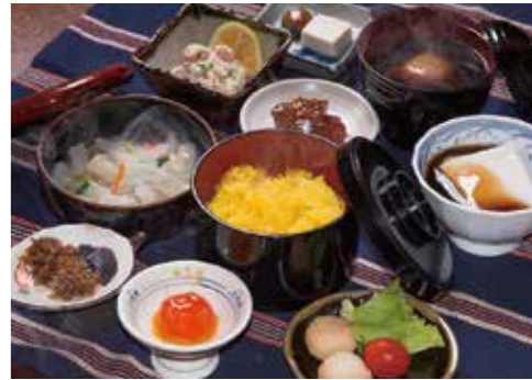
臼杵の郷土料理「黄飯」