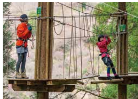
自然体験型アクティビティ