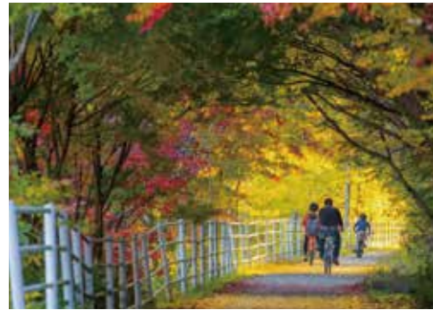
耶馬溪でのサイクリング体験