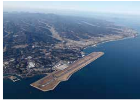
大分空港は宇宙港へ

観光産業に関わる事業者の事業継続を確保するため、経営革新計画の策定・実行等も見据えた経営力の強化を進めます。さらに観光産業の基盤強化などを図るため、DXの導入等により観光事業者経営変革を促します。また、ツーリズム大学の開催など次世代を担う観光人材の確保・育成を促進します。