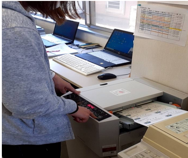
・名刺専用カッターによる作業