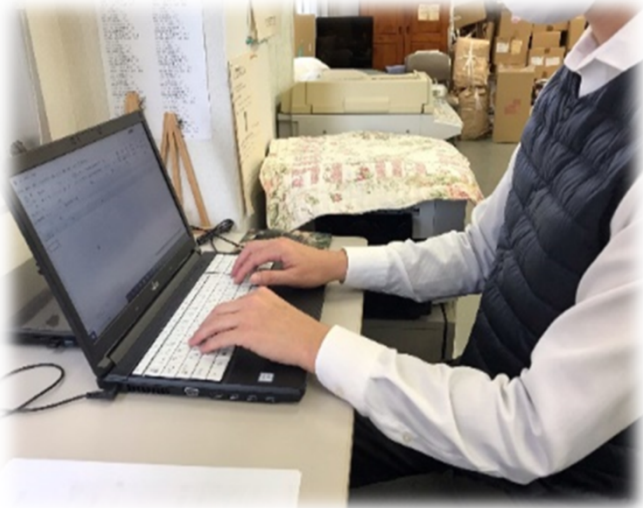
・名刺作成専用ソフトでの作成