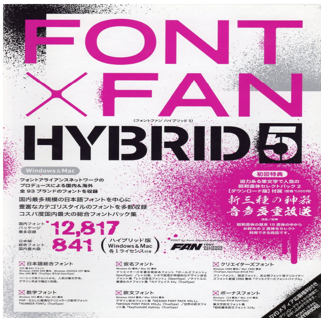
・FONT x FAN HYBRID5を導入 日本語841フォントに対応しています