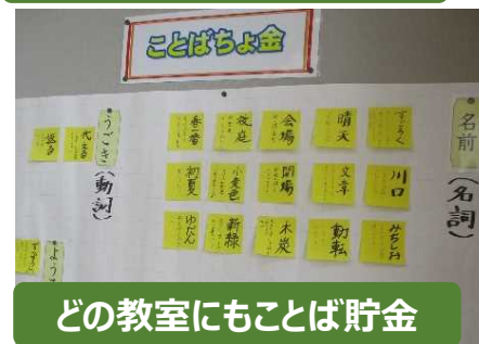
どの教室にもことば貯金