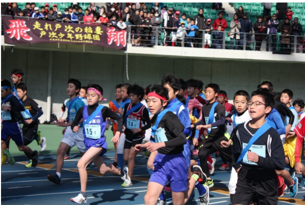
大分県スポーツ少年団駅伝交流大会