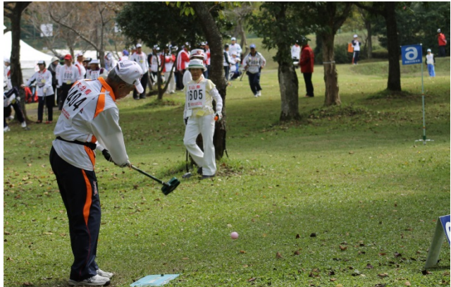
ねんりんピックグラウンド・ゴルフ競技