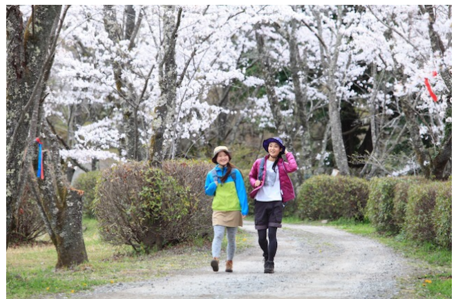
九州オルレ奥豊後コース