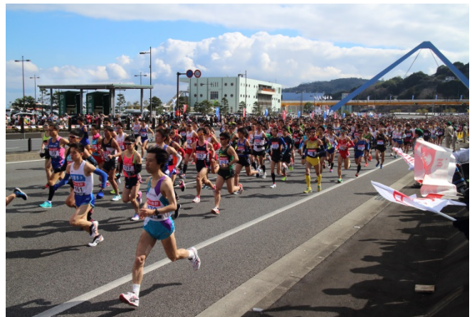
別府大分毎日マラソン大会