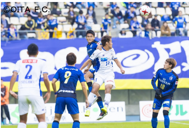
J2リーグ 大分トリニータ公式戦