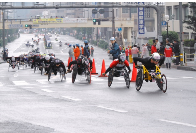
大分国際車いすマラソン大会

県は、スポーツを通じて、地域間交流・世代間交流・国際交流を促進し、地域の活性化を図るため、総合型地域スポーツクラブの活用、豊かな自然環境の活用など地域の特性に応じた取組への支援、スポーツツーリズムの推進、スポーツの競技会などの催しの開催・誘致その他の必要な施策を講じます。