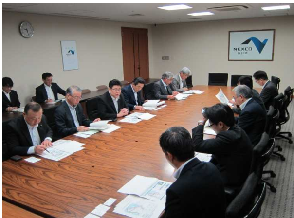
平成27年9月3日(木) NEXCO西日本 ○東九州自動車道の整備に係る要望について