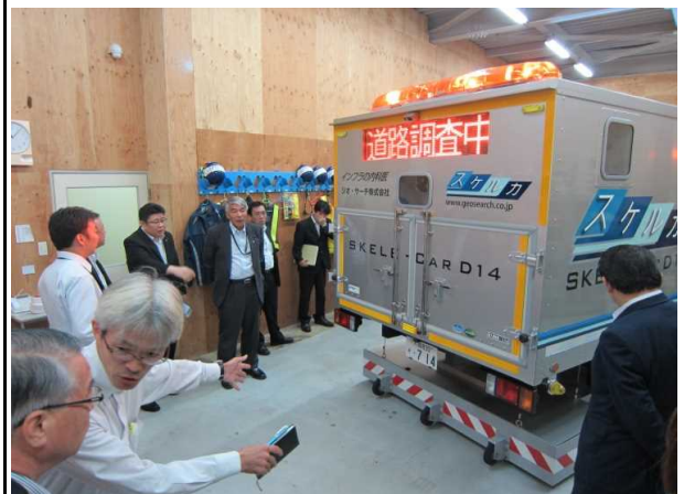
平成27年9月3日(木) ジオ・サーチ(株) ○路面下空洞探査の技術について