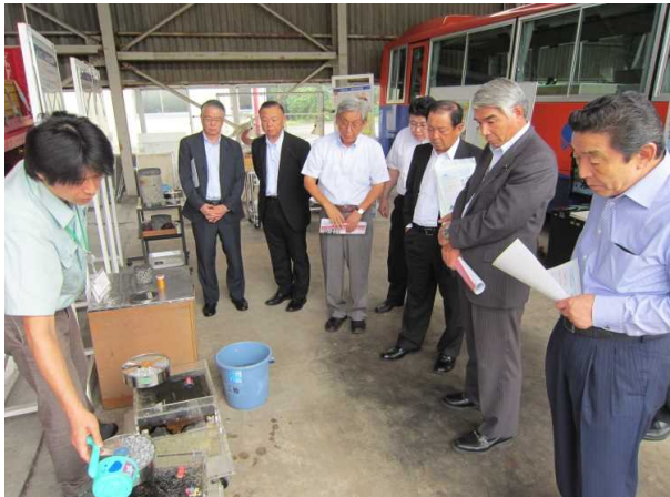
平成27年9月1日(火) 国立研究開発法人 土木研究所 ○河川、ダム水利研究等について