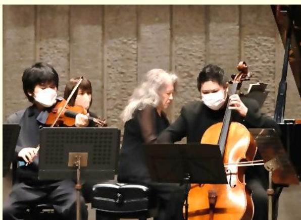
マルタ・アルゲリッチさんによる 開幕記念演奏

『東アジア文化都市2022大分県』の開幕式典を2022年5月22日（日）に大分県別府市で開催しました。「東アジア文化都市事業」は、日中韓3カ国において、文化芸術による発展を目指す都市を選定し、都市間交流を含む様々な文化芸術行事を1年間にわたり実施する国際的な文化交流事業です。本年は、日本の開催都市に大分県が選定され、中国の温州市と済南市、韓国の慶州市とともに様々な文化交流に取り組みます。