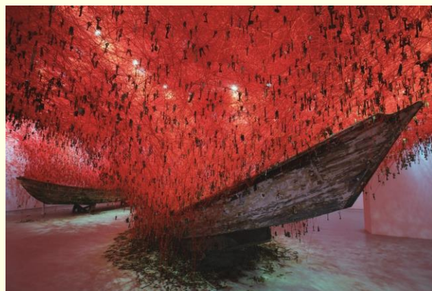
Chiharu Shiota The Key in the Hand, 2015

関連行事として県内の芸術文化団体による公演なども催され、県民をはじめ多くの来場者が芸術や文化に触れました。