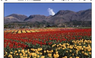
阿蘇まで続く久住高原の大パノラマ