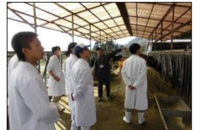
【九州大学高原農業実験実習場】