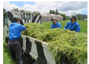
【サファリパーク飼料栽培実験】