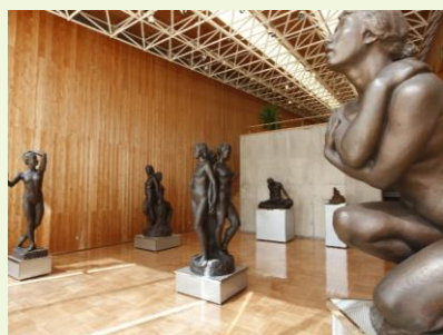
朝仓文雄纪念馆（朝地町）