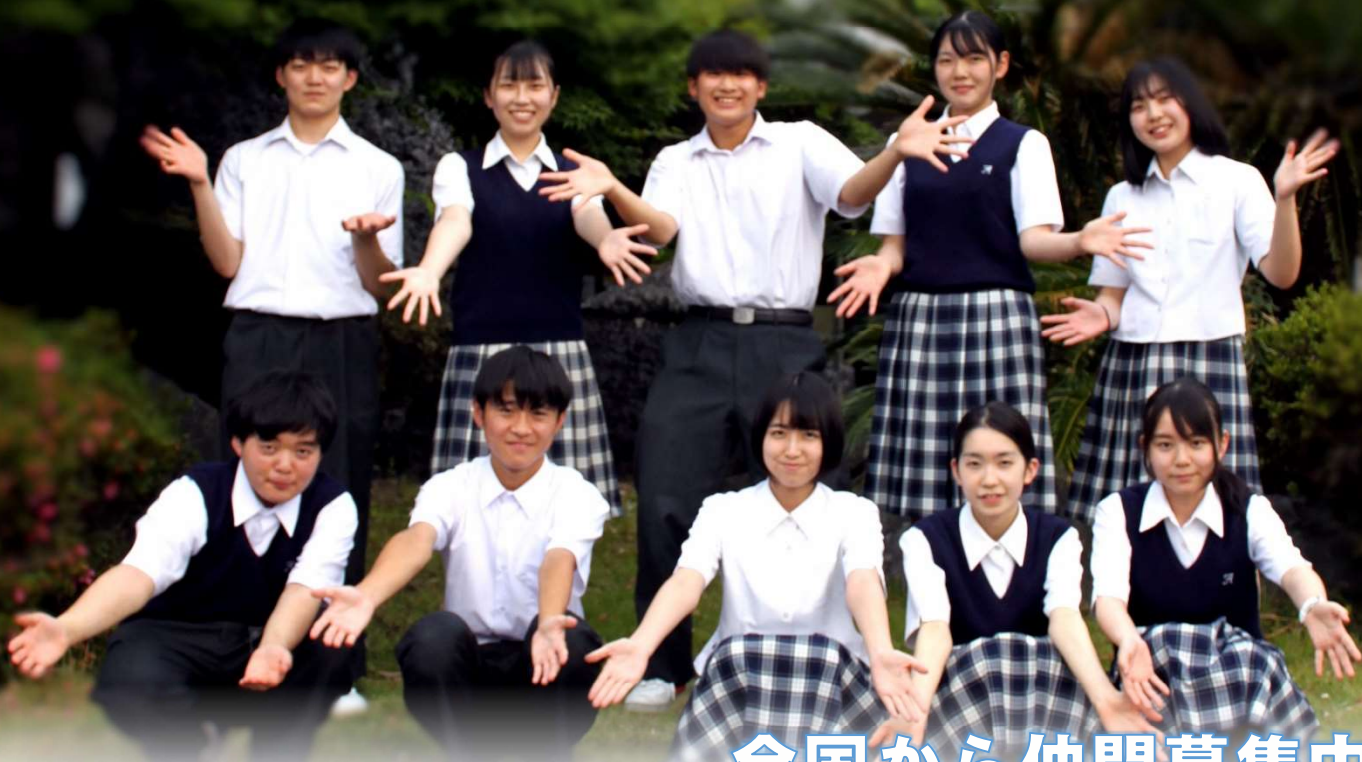
安心院高校商業部のメンバー