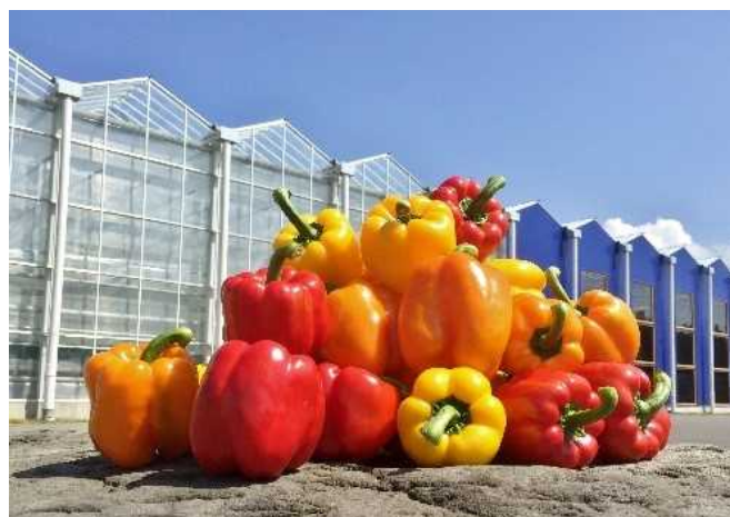
(株)タカヒコアグロビジネス

キャベツ16ha。福岡県の企業が令和3年度から大分県九重町で大規模キャベツ栽培を始めました。農業参入の動機、農業の可能性など経営者から直接お話を伺います。