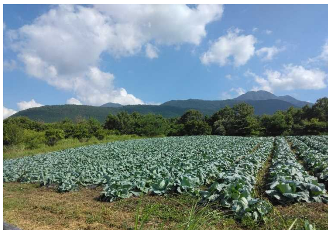
(株)エー・ワン 飯田高原ファーム

キャベツ16ha。福岡県の企業が令和3年度から大分県九重町で大規模キャベツ栽培を始めました。農業参入の動機、農業の可能性など経営者から直接お話を伺います。