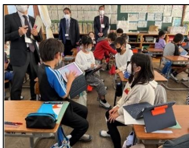
NO.353 2022年11月 大分市立松岡小学校