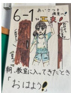
朝、教室に入ってきたとき「おはよう！」

学んだ事を思い出し、自分の力でやってみる。できたら違う方法も考える。時間いっぱいがんばる。