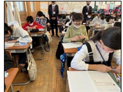
NO.354 2022年11月 大分市立松岡小学校

説明するときは、相手の目線に合わせて、丁寧に伝える。受ける人は、笑顔で共感的に聴く。