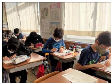
NO.351 2022年11月 大分市立松岡小学校