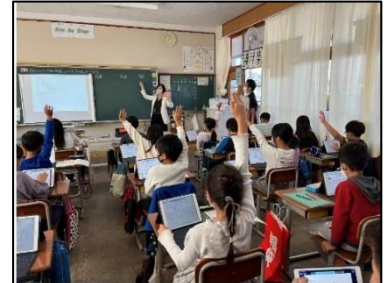
NO.352 2022年11月 大分市立松岡小学校

まねることからやってみる。でも、上手くはいかない。繰り返すことで、次第にできるようになる。