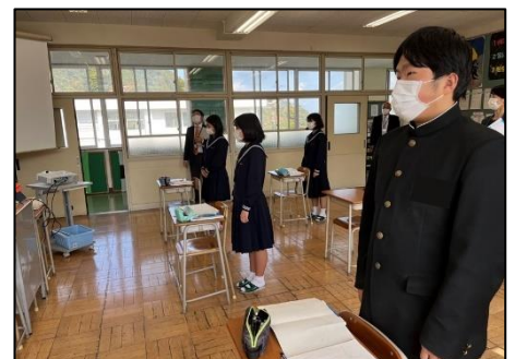
NO.428 2022年11月 大分市立佐賀関中学校

笑顔で学ぶと、隣の人も笑顔になっている。気がつく教室中が笑顔で学び合っている。笑顔は笑顔をつれてくる。