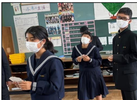
NO.426 2022年11月 大分市立佐賀関中学校

それぞれ個性があるから、いろいろな考えがでる。それらを認めるから、新たな考えが生まれる。だから、みんな成長する。