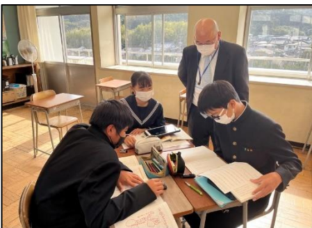
NO.427 2022年11月 大分市立佐賀関中学校