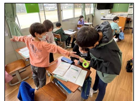
NO.557 2022年12月 大分市立長浜小学校

一人でも納得しないことは、みんなまで協力して、粘り強く最後まで頑張って解決する。