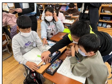
NO.555 2022年12月 大分市立長浜小学校

腕が伸びると背筋も伸びる。顔が上がる。意欲も高まる。そんな友達が教室に学ぶ空気を創る。