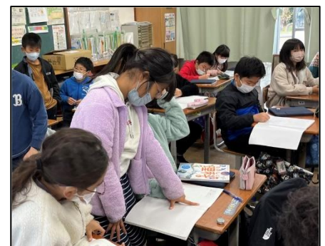
NO.556 2022年12月 大分市立長浜小学校