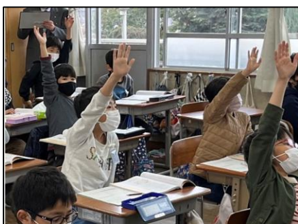
NO.554 2022年12月 大分市立長浜小学校

考えを出し合うと、共通点や相違点が明確になる。ここから、みんなが納得する解を探す。