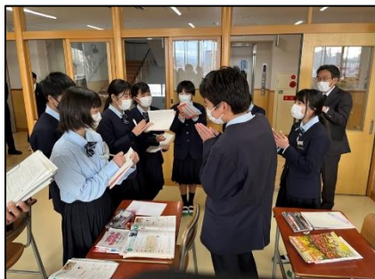
NO.553 2022年12月 大分市立碩田学園

「お先にどうぞ」優しい思いが伝わるから、安心して発表できる。共感的に聴くことができる。