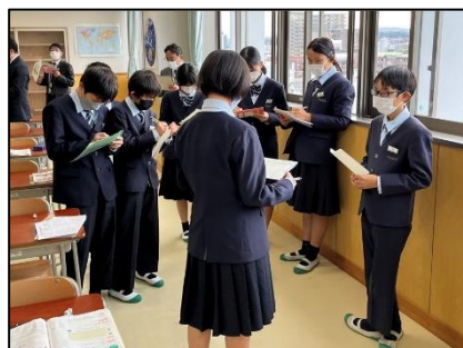
NO.552 2022年12月 大分市立碩田学園

拍手はされた人も、した人も共に笑顔になる。笑顔がつながると、それぞれ自分らしさが出せる。