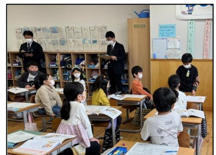
NO.551 2022年12月 大分市立碩田学園

友達の発表の良い点を参考にしながら、自分の発表に生かす。だから、真剣に観察する。