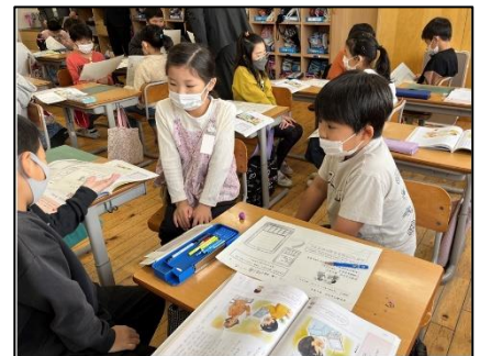
NO.550 2022年12月 大分市立碩田学園