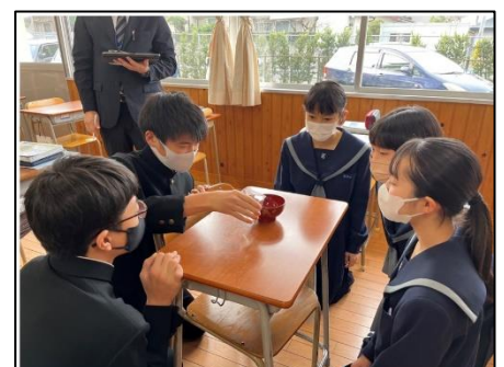
NO.564 2022年12月 大分市立滝尾中学校

それぞれの考えを出し合い、認め合うことで、共通点や相違点が明らかになる。だから、学びが深くなる。