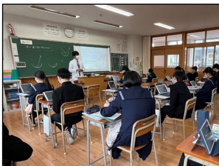
NO.562 2022年12月 大分市立滝尾中学校