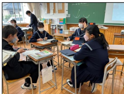
NO.563 2022年12月 大分市立滝尾中学校

これまでの知識や経験から、予想して、実際に観察すると、疑問点がみえてくる。そこから、自分達が求める課題が見つかる。