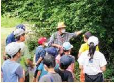
野外での樹木観察(森林環境税の活用例)