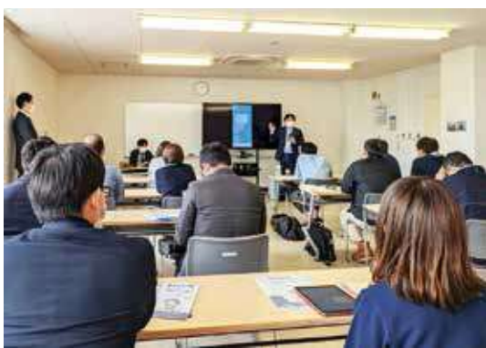
▲地域デジタル活用支援員研修

例えば、災害が発生した時、「避難所の混雑情報がスマートフォンですぐ確認できれば、安心して避難できるのに!」。例えば、急いでタクシーを呼びたい時、「近くにいますタクシーがすぐ来てくれないかな」。日々の暮らしの中にある、「こうなってほしい」「こうだったらいいのにな」というビジョンは、現実のものになりつつあります。