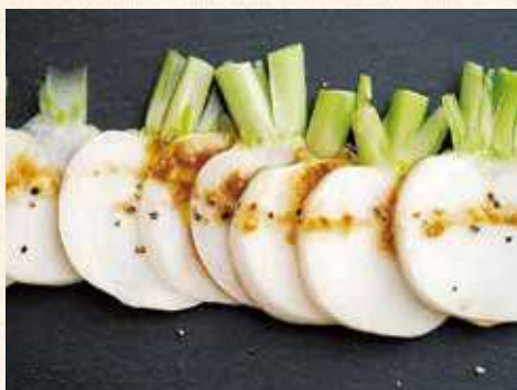
レシピ提供：石見 典子(杵築市)

ゆずごしょうがピリッと効いた、ちょっと大人なサラダ。かぶを切って、手作りドレッシングをかけるだけなので、簡単にチャレンジできます!! 写真のような切り方の工夫だけで、ぐっとオシャレに♪