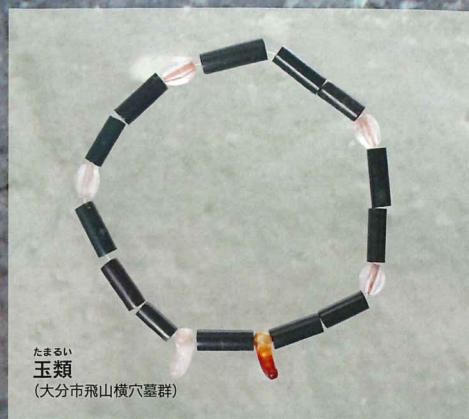
たまらい 玉類 (大分市飛山横穴墓群)