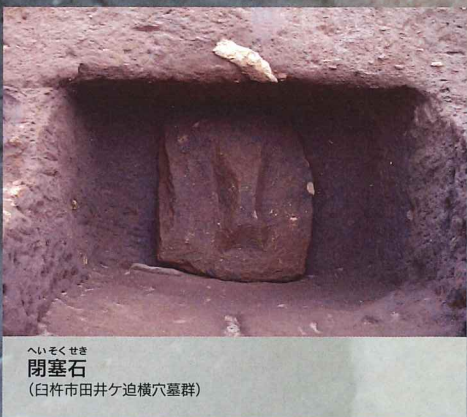
へいそくせき 閉塞石 (臼杵市田井ヶ迫横穴墓群)