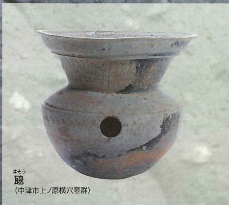
はそう 甕 (中津市上/原横穴墓群)