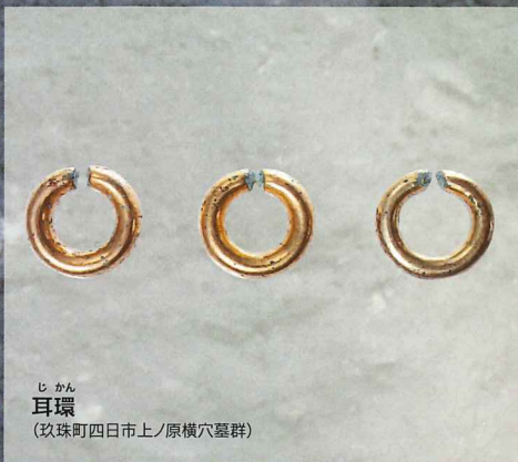
じかん 耳環 (玖珠町四日市上/原横穴墓群)