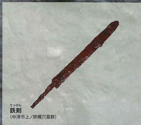
てっけん 鉄剣 (中津市上/原横穴墓群)