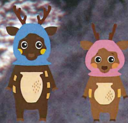
レキシカくん マイカちゃん

後援 / 大分合同新聞社 NHK大分放送局 OBS大分放送 TOSテレビ大分 OAB大分朝日放送