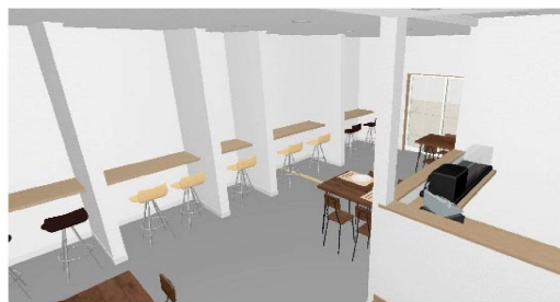
図-7 内観パース（ワーキングスペース）