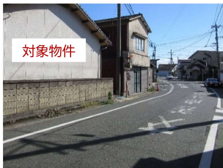
写真-2 西面の道路（幅員：6.75m）