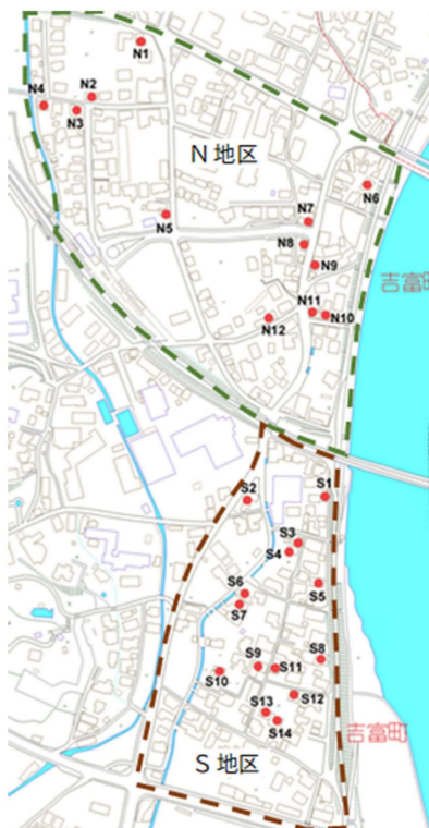
図-3 空き家の分布状況