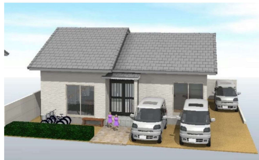
図-5 外観パース（南面）