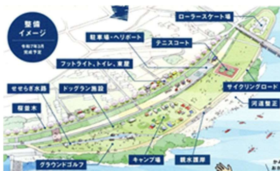
図-8 山国川下流地区の活用案（かわまちづくり）