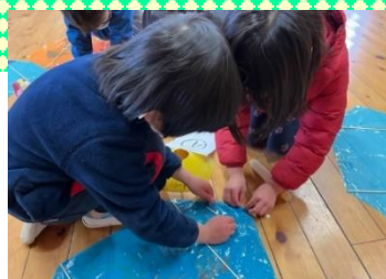
一緒にやってみよう