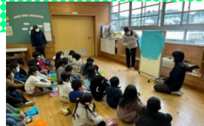
話をよく聞いて、自分で作るぞ!