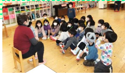
「1年生やさしかったね。」 「僕も棒のところは、自分でできたよ。」