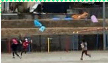
「ほら、見て!見て!あがったよ!」